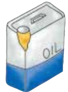
中身の入った 塗料・廃油缶