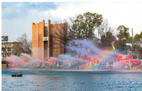
令和8年消防出初式の様子

1月11日(日)、市民文化ホールで市消防団、市女性防火クラブ、岐阜市消防本部による消防出初式が開催されました。