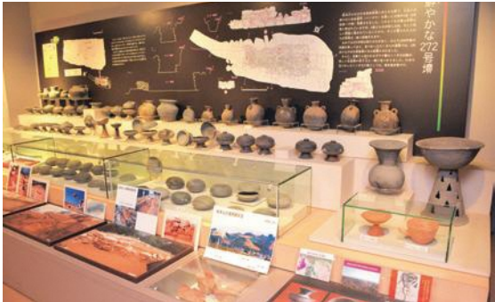
古墳と柿の館 272号墳の展示

本巣を代表する淡墨桜と船来山古墳群両方とも継体天皇との関わりが示されているのは偶然でしょうか。