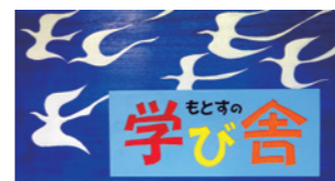
右)本巢市の適応指導教室 上)「本巢の学び舎」看板

「本巢の学び舎」は、本巢市の適応指導教室として、富有柿センター3階に新たに作られた教室です。全国的に不登校児童生徒は増加傾向で、本巢市でも同様の傾向にあり、全児童生徒の2割にあたります。主な理由としては「無気力」「不安」があげられます。これまでは、市の担当の教育相談統括指導員や全小中学校に配置されている教育相談員が、担任と連携を図りながら、相談室登校の子どもを支援してきました。真正分庁舎に設置されている適応指導教室「たんぽぽ」も令和3年度新設の「本巢の学び舎」も、どちらも不登校児童生徒の社会的自立を目指しています。「た