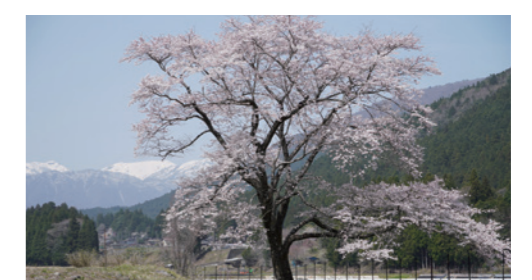
神龍桜と能郷白山(PN...本巣大好き) 満開の神龍桜と白く輝く能郷白山のコラボ。春の訪れを感じて嬉しくなりました。