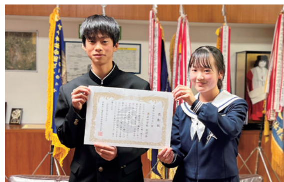
真正中学校の生徒会

【真正中学校】生徒会では、これまで掲げていた「学校人権宣言」を「学級人権宣言」へ、さらには「個人の人権宣言」へと、一人一人が行動に移せるよう目標を具体化させました。その結果、積極的に取り組む生徒が増加。個々の変化が、人権以外の取り組みにも良い影響を与え、学校全体の変化につながりました。これまでの活動の問題点を改善し、さらに磨き上げ、推進できている証しです。