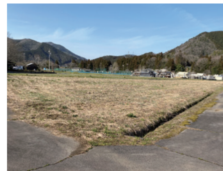
アスパラガス栽培予定地の神海地区の農地

今回借りた土地は、神海地区の特徴である「黒土」でなく、砂地で非常に排水性に優れた土地です。黒土は保水性が