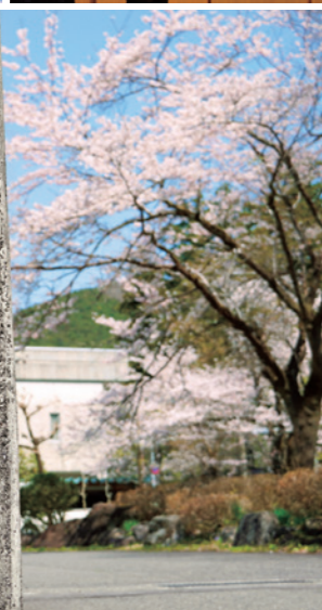
8_入学式にて9年生の誘導で入場する新1年生と新7年生 9_緊張した面持ちの新入生 10_開校への熱い想いを語る薄田校長 11_児童生徒代表の言葉を述べる吉田響さん 12_生徒による校歌の紹介 13・14_児童生徒による校歌斉唱 15_戸崎浩志さん書による校門の門柱銘板