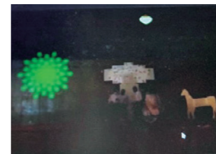
右)オンラインで中島さんからプログラミングのアドバイスを受ける生徒 上)制作した動画の一場面

「未来の地球学校」とは、市数学のまちづくりアドバイザーで数学者の中島さち子さんがSTEAM教育(科学・技術・工学・芸術・数学の5つの単語の頭文字を組み合わせた、これからの時代の教育)の普及に向けて取り組んでいるプロジェクト組織です。昨年度1年生では、ふるさと本巢市の魅力を映像で伝えたいと考えました。制作にあたり、生徒一人一人が自分の得意分野を生かせるよう「企画・運営・演出、映像技術、デザイン技術、オブジェ、音楽、ダンス」のチームに分かれ、11月末から準備を進めました。生徒がさまざまなアイデアを出し合い、時には本を買って調べたり、中島先生にアドバイ