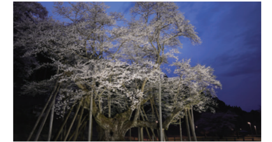
圧巻のライトアップ(PN...とりっぴー) 淡墨桜が3年ぶりにライトアップ。幻想的な姿に思わずうっとり♥