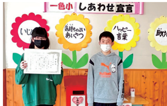
一色小学校の企画・代表委員