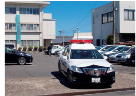
現場に急行するパトカー

令和3年中の県下の110番通報受理件数は11万458件で、前年より約1800件増加しました。このうち交通関係が5万3151件、犯罪などの情報関係が2万1062件で、全体の約67%を占めました。一方、当署管内での受理件数は6877件で、前年より約170件増加。このうち、交通関係は3320件、犯罪情報関係は1277件で、こちらも全体の約67%を占めています。また、収穫期の柿の盗難や畑で