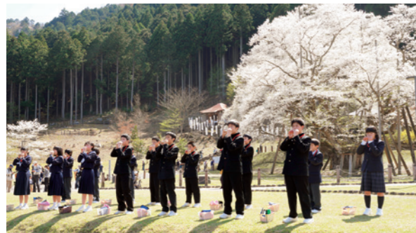
開校式の翌日には、淡墨公園で桜ガイドに取り組んだ。観光客らにガイドを行い、オカリナ演奏も披露した

■特色ある教育 かがやき科、ふるさと科、外国語活動・英語教育、オカリナ活動や運動遊びなど多彩なカリキュラムを編成しています。 自分の可能性に気付き、自分を磨き高める「かがやき科」では、主体的・探究的な学びを通して、自分の夢を発見し、実現する力を育てます。 根尾への愛着と誇りを高め、持続可能な根尾の未来を創り出す「ふるさと科」では、根尾の過去や現在を知り、地域とのかかわりのなかで活力ある未来を目指して行動する力を育てます。 外国語活動・英語教育では、生きて働くコミュニケーション能力を培い、グローバル化の進展に対応できるコミュニケーション能力と国際理解力を育てます。9年間を見通した外国語活動・英語教育を行うことで学びが連続し、「聞く・話す・読む・書く」の4技能をバランスよく伸ばしていきます。 心と体を鍛える「げんきタイム」は、基礎体力、運動能力を高めるため「運動遊び」を中核にした体力づくりの時間に位置付けます。本巣市では、市内各幼稚園