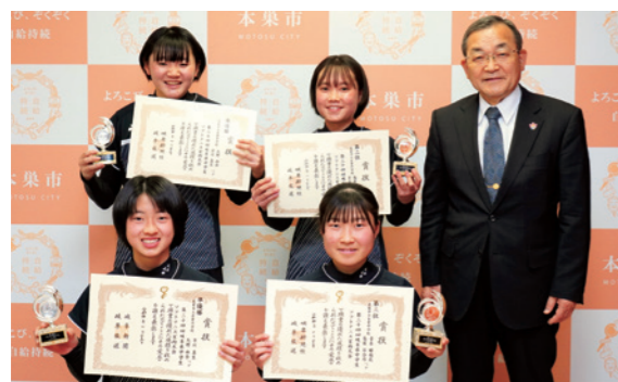
チームでベストを尽くすと誓った選手たち