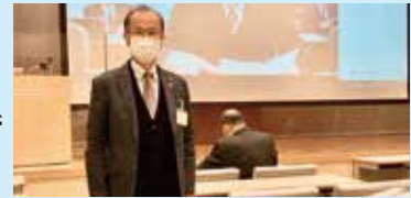
▲研修に参加する議員