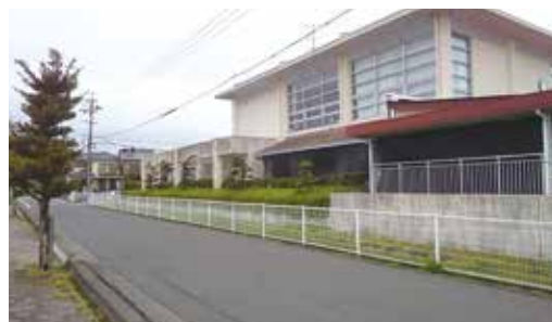
▲現在の弾正幼稚園(西側)