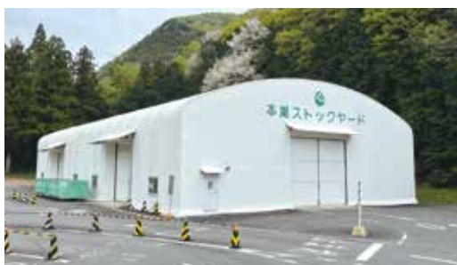
▲本巢ストックヤード