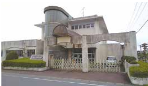
▲現在の弾正幼稚園(北側)