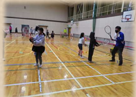
ステップの踏み方の練習