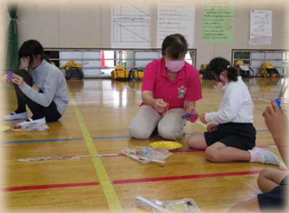
難しい所はスタッフと一緒に作製