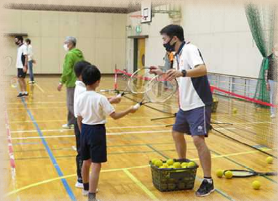
ラケットの持ち方を教えてもらう姿