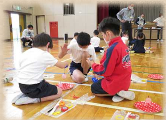
完成したコマで対決する姿

令和4年11月 7日(月) 午後3時10分～午後5時 令和4年12月19日(月) 午後3時10分～午後5時 ミニテニス 講師：ルネサンス岐阜