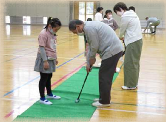
上手に入るコツを教えてもらう姿