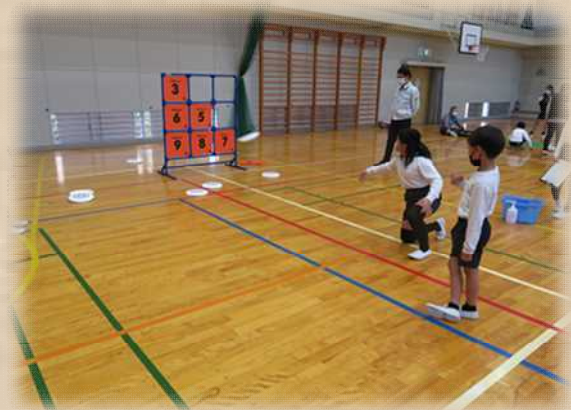
コツをつかんで投げる姿