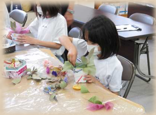
先生の説明を聞きながら作製する様子