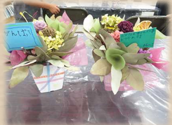
ドライフラワーアレンジメントの完成