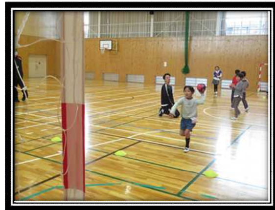
ステップシュートの練習する姿