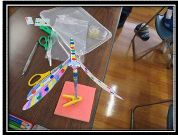
バランスとんぼの完成