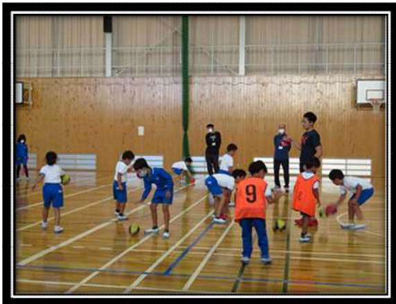
ドリブルの練習をする姿