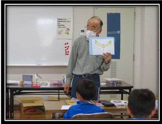
講師より作品の説明