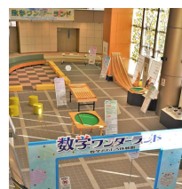
数学のまちづくり事業