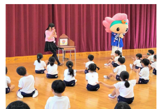
本巣市魅力発信推進業務