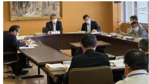
▲文教福祉委員会(真正分庁舎)