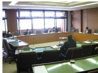
▲総務企画委員会協議会(本庁舎)