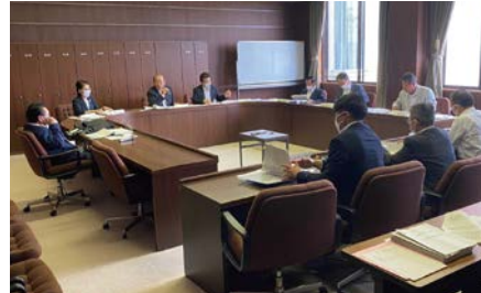
▲産業建設委員会・協議会(糸貫分庁舎)