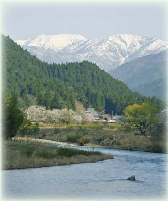
▲残雪を纏う能郷白山