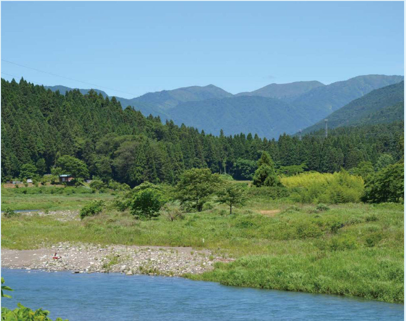
▲開運橋から望む能郷白山(根尾板所地内)