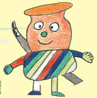
船来山古墳群 マスコットキャラクター