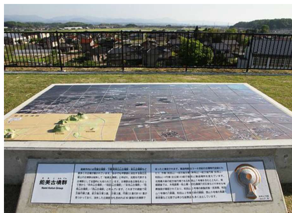
図 111 解説板(航空写真、立体模型)