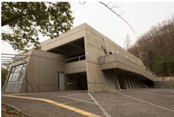
図 81 管理・休憩施設