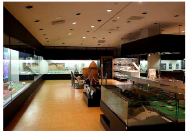
図 118 ガイダンス施設(熊本市塚原歴史民俗資料館)