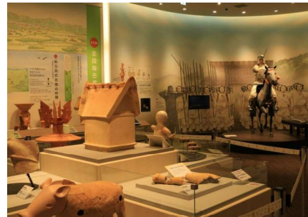
図 106 ガイダンス施設 (体感！しだみ古墳群ミュージアム)