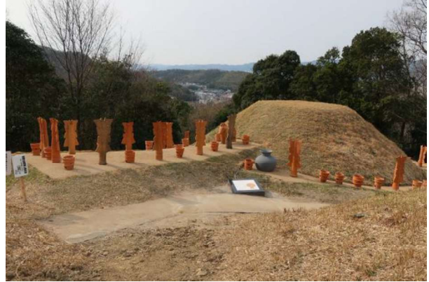
図 90 墳丘復元と復元埴輪の展示