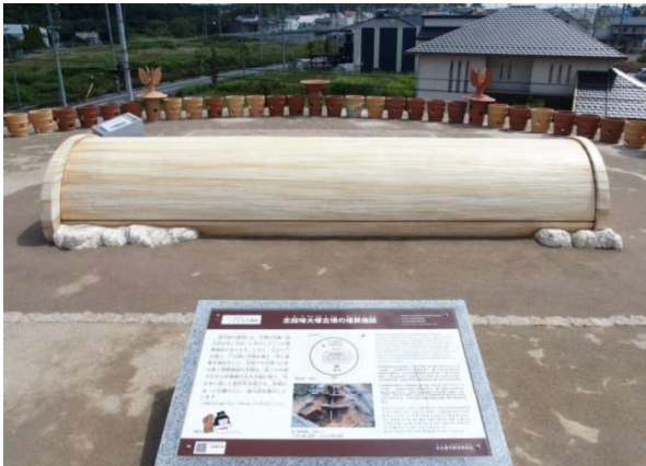
図 103 埋葬施設の復元展示と解説板