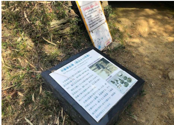
図 91 個別の解説板