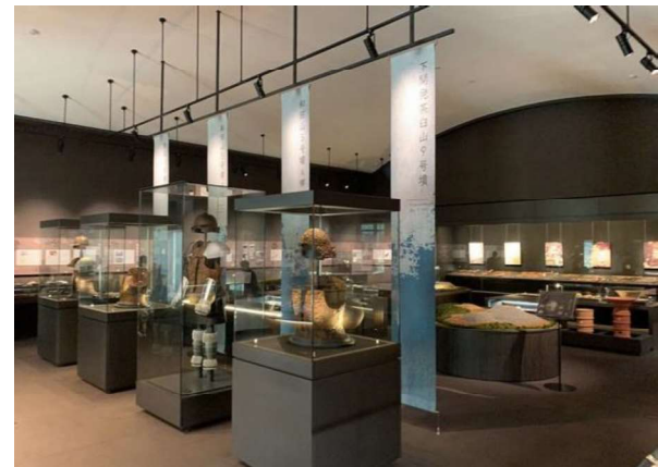
図 112 ガイダンス施設(能美ふるさとミュージアム)