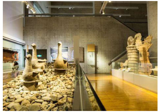
図 80 ガイダンス施設