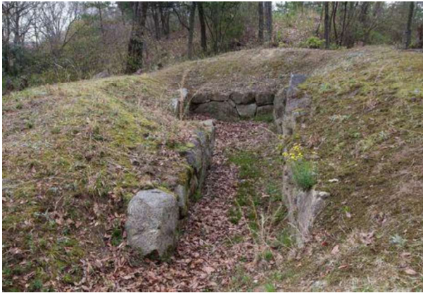
図 77 石室の露出展示