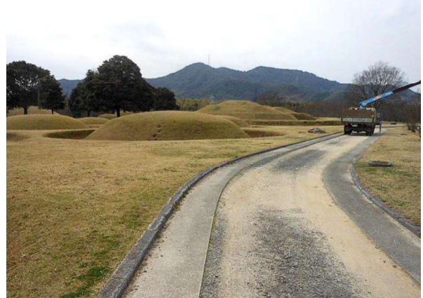
図 114 管理用道路