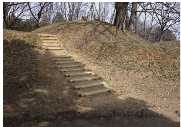
図 86 墳丘復元と園路（階段）