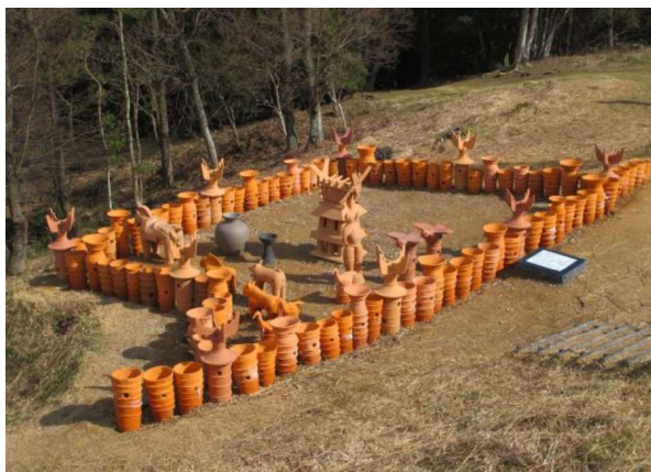
図 93 埴輪祭祀の復元展示