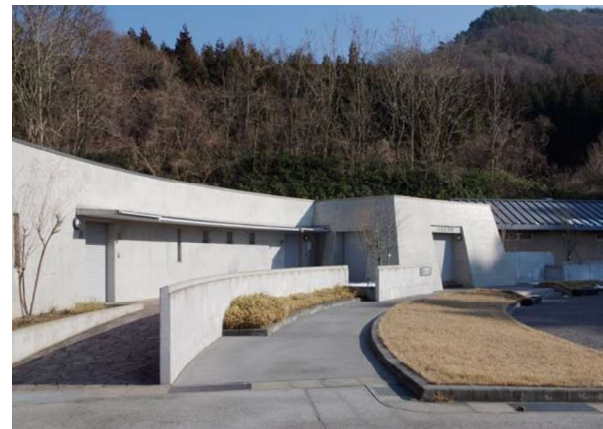
図 100 ガイダンス施設（大室古墳館）