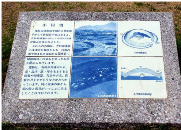
図 115 個別の解説板