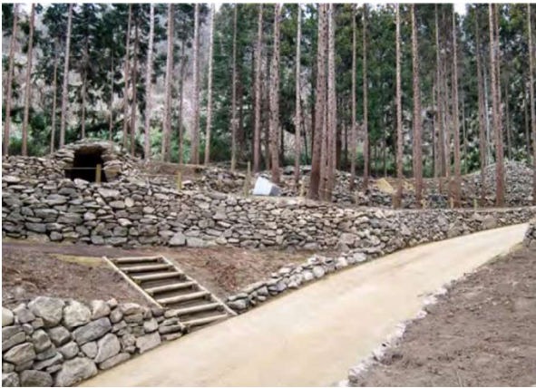
図 97 墳丘復元と園路