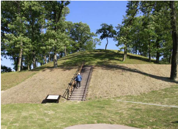
図 107 墳丘復元