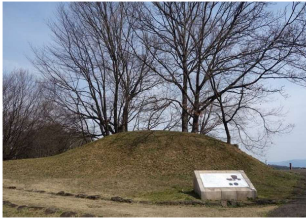
図 83 墳丘復元とサイン