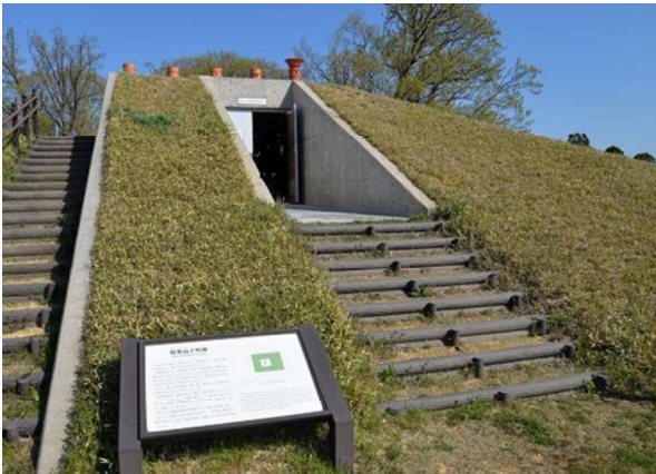
図 109 埋葬施設の展示室入口