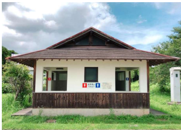
図 117 トイレ