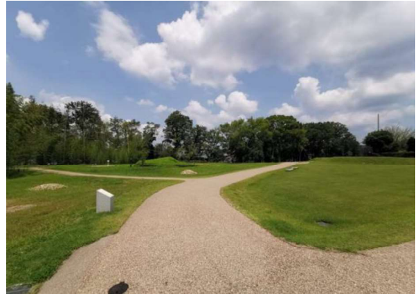
図 104 園路