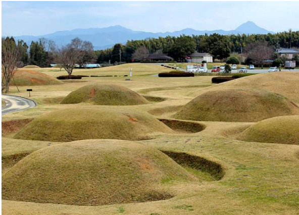
図 113 墳丘復元