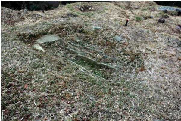
図 89 石室の露出展示