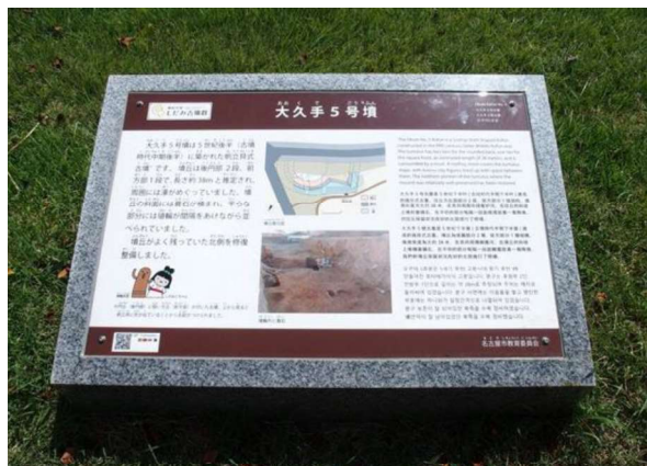
図 105 個別の解説板