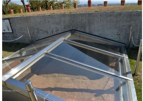
図 110 埋葬施設の展示(覆屋)