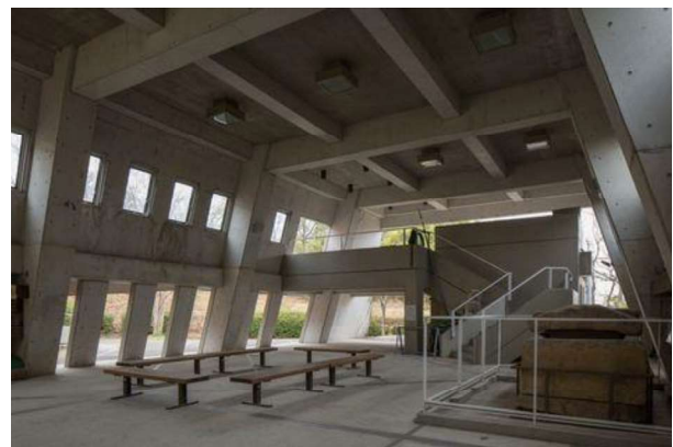
図 82 管理・休憩施設