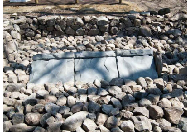
図 96 石室の復元展示