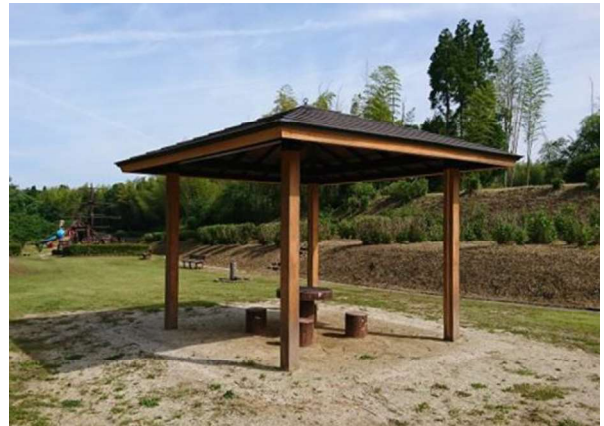
図 116 休憩施設(四阿)