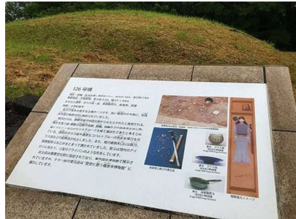
図 84 個別の解説板