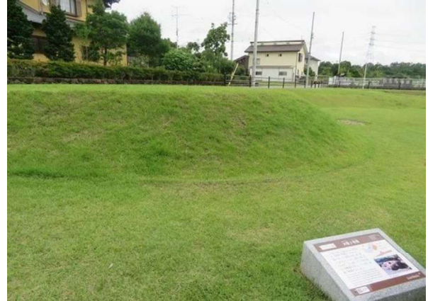
図 102 墳丘復元と解説板