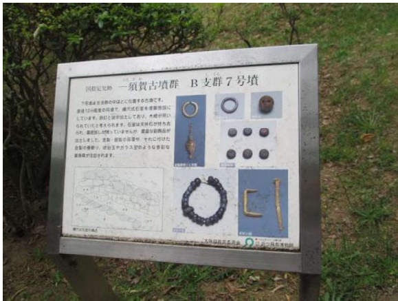
図 79 個別の解説板