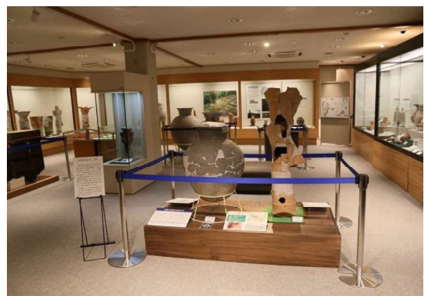
図 94 ガイダンス施設