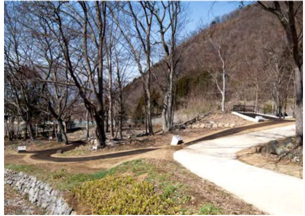
図 98 園路