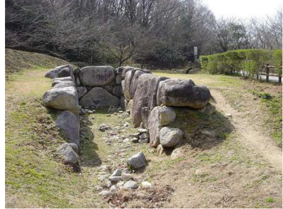
図 78 移築した石室の露出展示