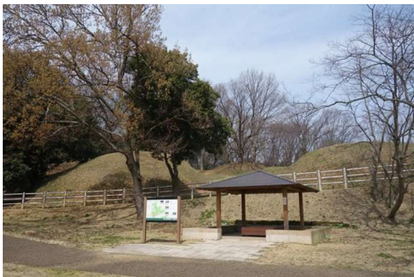
図 87 墳丘復元と休憩施設（四阿）