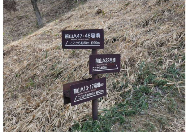
図 92 案内板