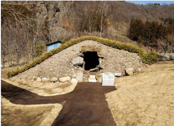
図 95 墳丘復元