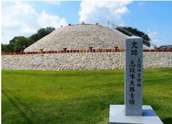
図 101 墳丘復元と史跡標識