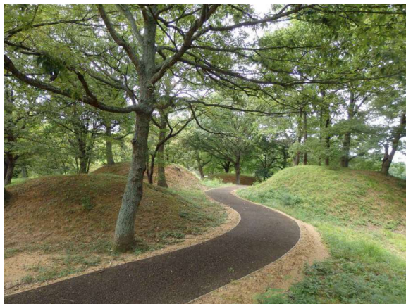
図 85 墳丘復元と園路