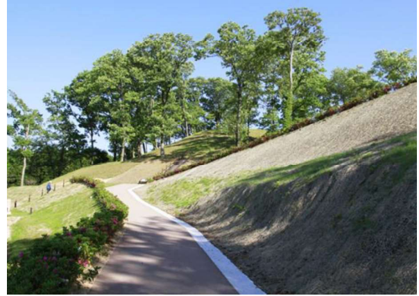
図 108 園路