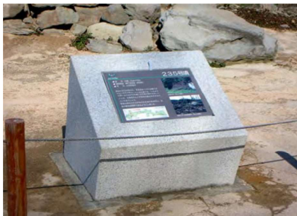
図 99 個別の解説板