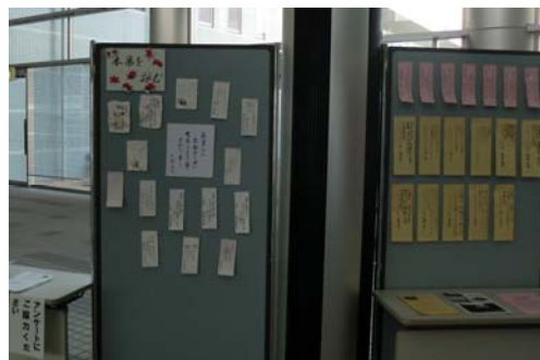
▲俳句短歌作品も展示しました