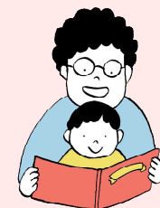
●幼少期から読書の環境を整えよう

家読(うちどく)とは 家族と本を読んで感想を伝え合ったり 好きな本をすすめ合ったり、読書体験を 共有することでコミュニケーションを 図り、家族の絆を強める取り組み