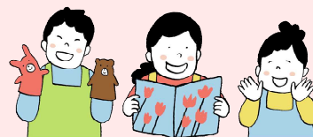
●地域ボランティアの読み聞かせ