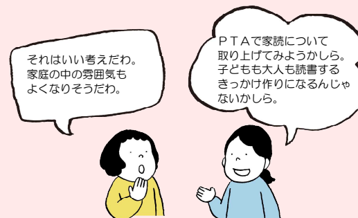
●PTA(家庭教育学級)で取り組もう