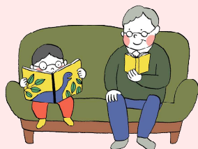
●各家庭で家読時間を設けよう

家読(うちどく)とは 家族と本を読んで感想を伝え合ったり 好きな本をすすめ合ったり、読書体験を 共有することでコミュニケーションを 図り、家族の絆を強める取り組み