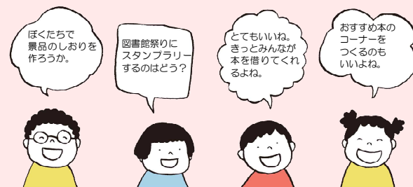
●読書に関するイベント等に子どもが参画しよう