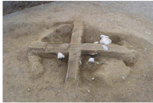
写真 竈遺構土器、石出土状況（西北から）