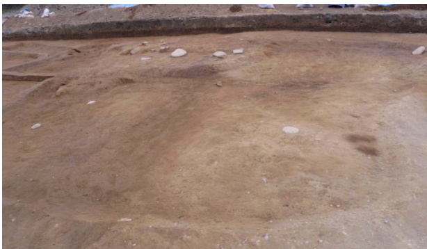
写真 焦土遺構検出（南から）

SB8の東側で出土しました。住居内の北側が赤黒い土で厚く覆われていました。この中から大型の石と土手のようなものが出土しました。灰釉陶器などの土器も多数出土しています。このほか住居の隅で古代瓦が出土したほか、焦土が堆積した土坑2基が出土しています。