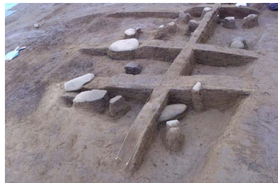
写真 焦土遺構土器、石出土状況（東から）