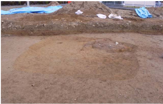
写真 竈遺構検出（西から）

住居の東側は、赤い焦土や黒い炭で覆われていました。掘り進めると、竈ではないかと考えられる遺構が出土しました。竈の中からも、住居の床からも土器が出土しました。このほか柱穴が1基出土しました。