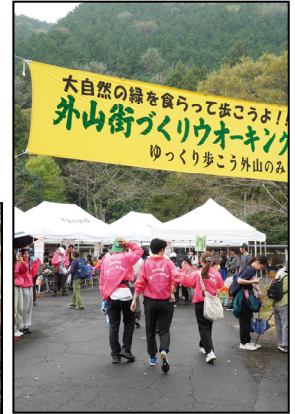
外山街づくりウォーク