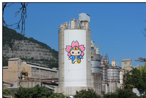
大規模な工場とその周辺の緑地