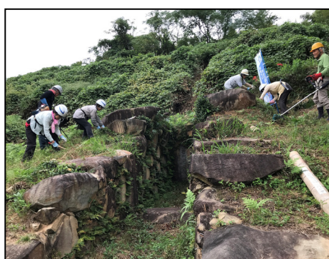
船来山古墳群ボランティア活動