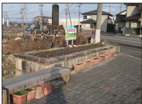
市民主体の活動により作られた花壇