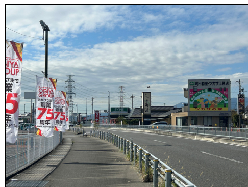
県道岐阜関ヶ原線沿道の商業地