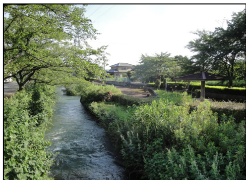
ホタル公園(席田用水)