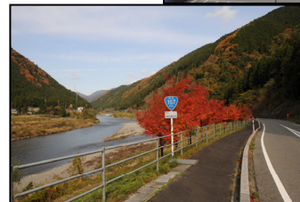
紅葉と国道 157 号