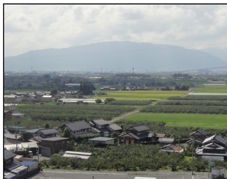
田園風景と調和した農村集落