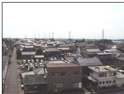
整然とした低層住宅地