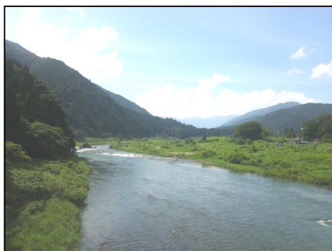
根尾川と山並みの風景