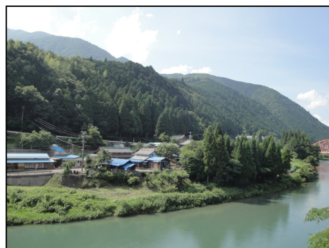
山に囲まれた集落