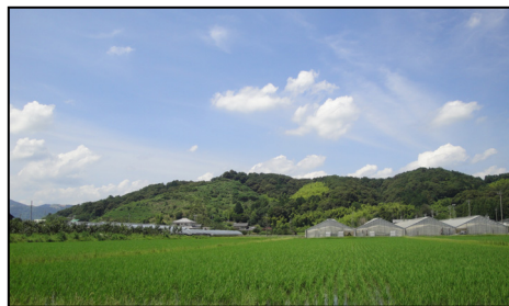
里山の風景(船来山)