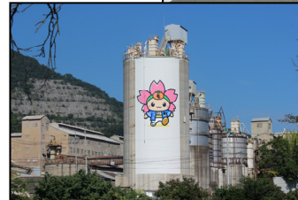
山を背景にした大規模な工場