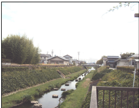
潤いある親水空間(糸貫川)