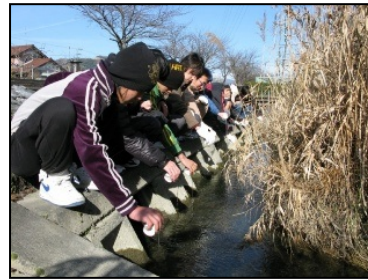
ホテルの保護育成活動

そのため、本市の景観づくりを進めていく過程においては、そこで生活する市民一人ひとりが景観づくりの主役であるという自覚を持って参加するとともに、事業者をはじめ、まちづくりの先導役である行政がそれぞれの役割や責任を正しく認識し、協働していきます。