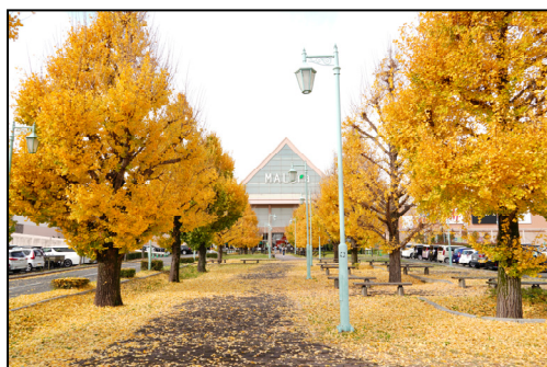
モレラ敷地内の銀杏