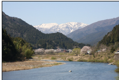
能郷白山と根尾地域の山並み

そのため、これらの人工的な改変を避けることを原則としながら、他法令に基づく行為制限(自然環境保全地域等)との連携や、景観面からの建築ルールの設定等を通じ、人々の生活・経済活動と自然景観との調和を図っていきます。