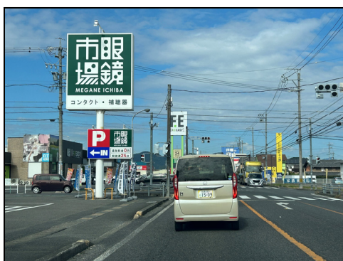
国道157号沿道の商業地