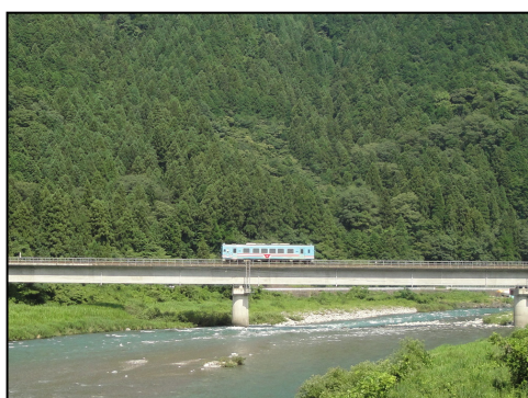
山並みを背景に走る樽見鉄道の風景