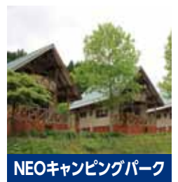
NEOキャンピングパーク