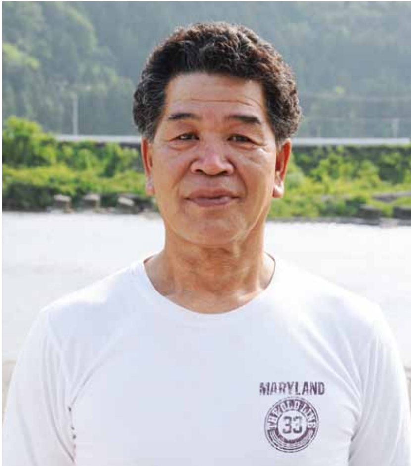
根尾川筋漁業協同組合 副組合長