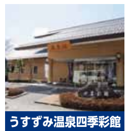
うすずみ温泉四季彩館