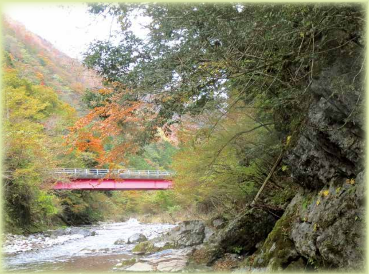
▲シカマイアが露出している地域