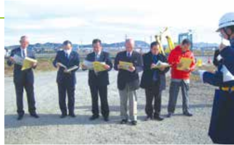
▲本巢PAの建設現場で担当者より説明を受ける