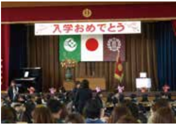
▲席田小学校入学式の様子