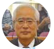
鵜飼 静雄 (日本共産党)