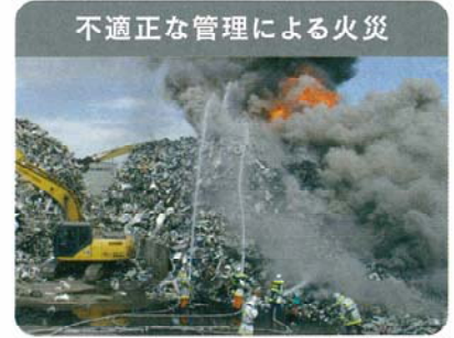
不適正な管理による火災

環境対策を行わずに廃家電を破壊することで、フロンガスや鉛などの有害物質が環境中に放出されます。