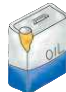
中身の入った 塗料・廃油缶