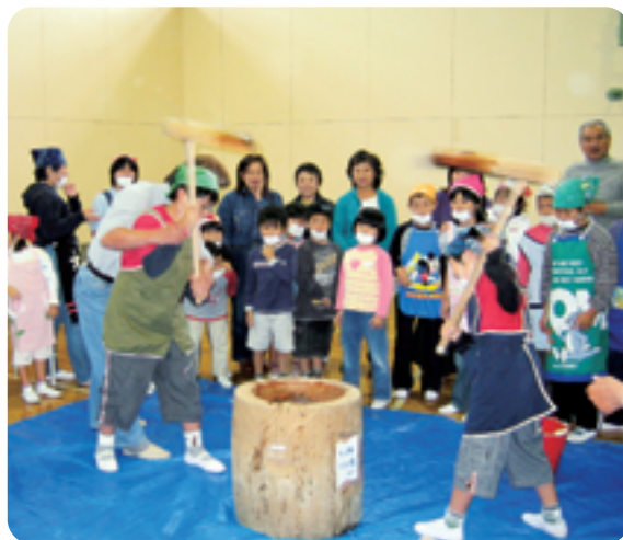
▲もちつき 自分たちで育てたもち米でつくりました

準備は大変でしたが、みんなのうれしそうな顔を見ることができたので、がんばってきて良かったなあと思いました。