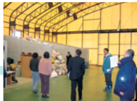
真正ストックヤードを視察する委員