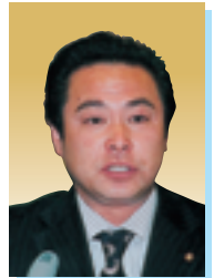
黒田 芳弘 議員