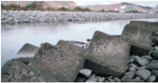
根尾川の推積中州の状況

生え、大量の砂礫が推積し、大水時に、住居より6〜7mの高位を水が流れることになり、地域住民の生命財産を守るため、市は国交省に浚渫（しゅんせつ）を早急に求める様願います。