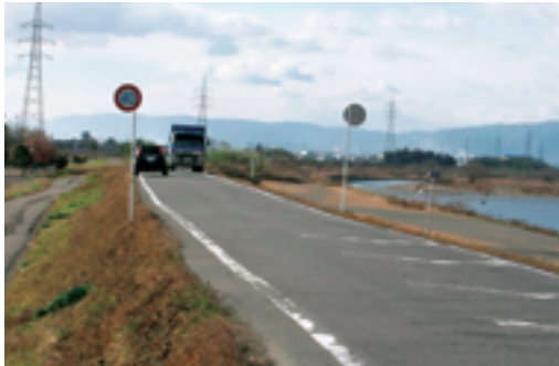
根尾川左岸堤防道路