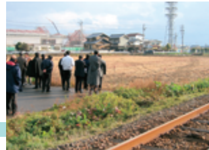
モレラ岐阜西側の樽見鉄道新駅予定地を視察する委員