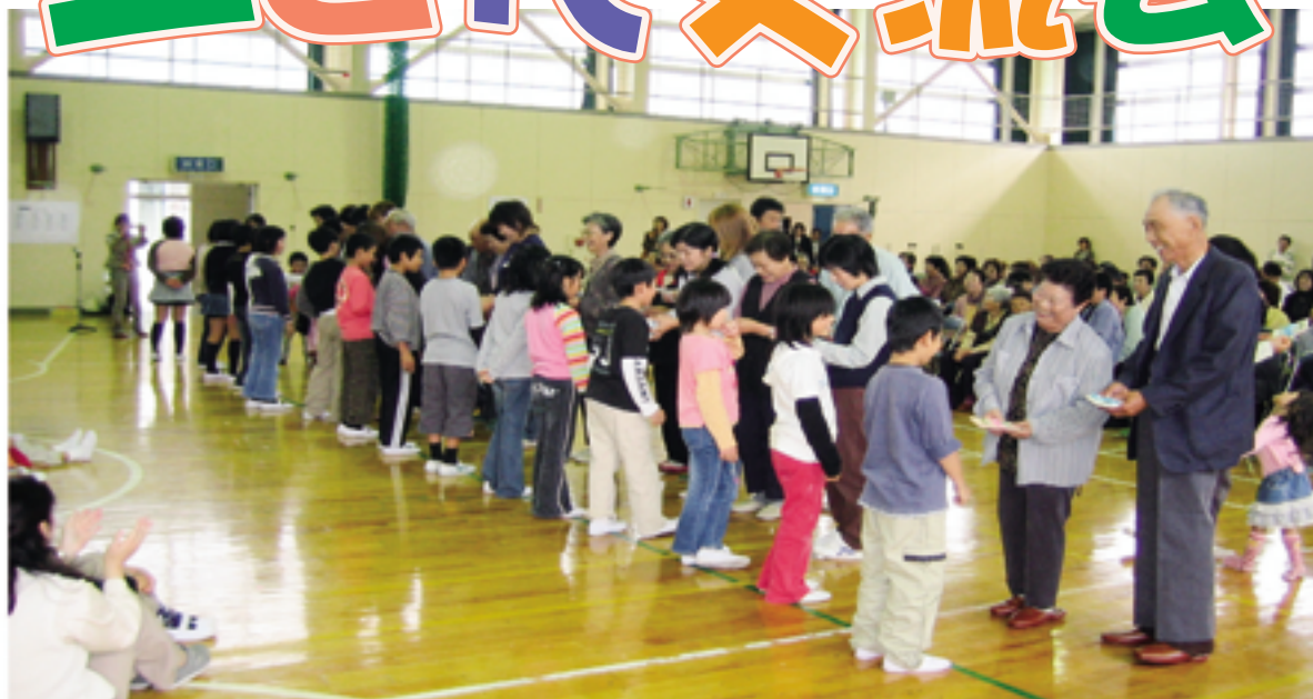
平成17年10月22日に行われました

三世代交流会は、昭和63年度に命名され、本年度で第18回目です。それ以前は感謝祭と呼んでいて、お世話になっている方々へ感謝の気持ちをこめて、みんなで収穫したものでおもてなしをしようという活動です。その精神は伝統として現在も引き継がれています。