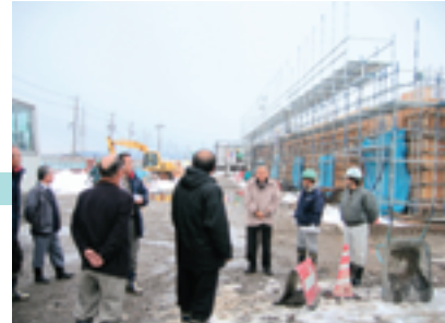
真正浄化センター工事現場を視察する委員