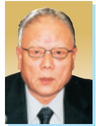
遠山 利美 議員