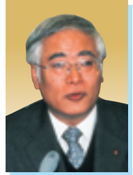
鵜飼 静雄 議員