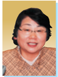
船 渡 洋 子 議員