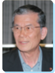
高田 文一 議員