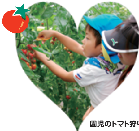
園児のトマト狩り

5月26日の本巢市産業祭に参加。地元産米のボン菓子の無料配布や、金魚すくいを行いました。