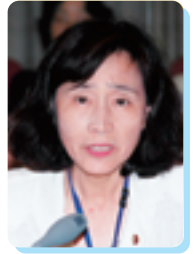
白井 悦子 議員