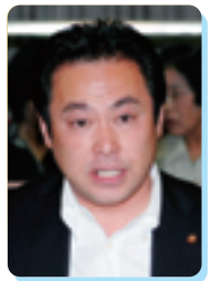
黒田 芳弘 議員