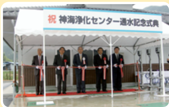
■ 神海浄化センター通水式(4月25日) 神海浄化センターの完成により、生活環境の向上と公共用水域の水質保全が図られます。