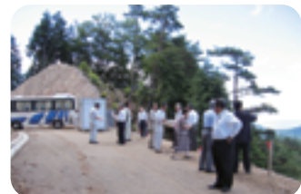
▲ 林道宮谷金坂線視察