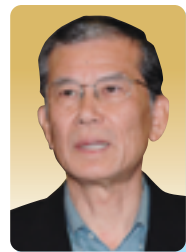
高田 文一 議員