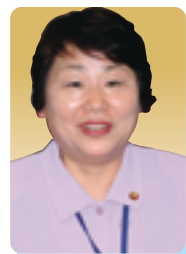
船渡 洋子 議員