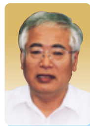
鵜飼 静雄 議員