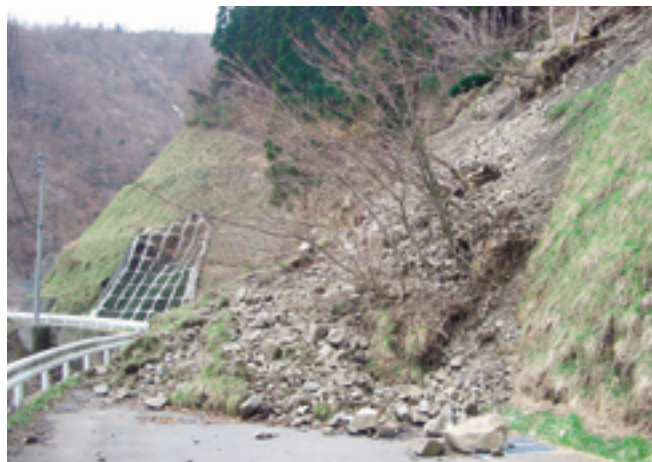
上大須林道災害現場