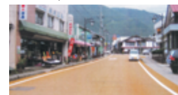
旧小坂町商店街のカラー舗装

商店街の活カ低下は事実であり、20年ほど前から協議してききましたが、意見集約までいならず、現状となっています。