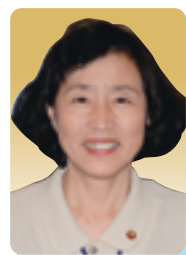
白井 悦子 議員