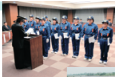
女性消防団員入団式