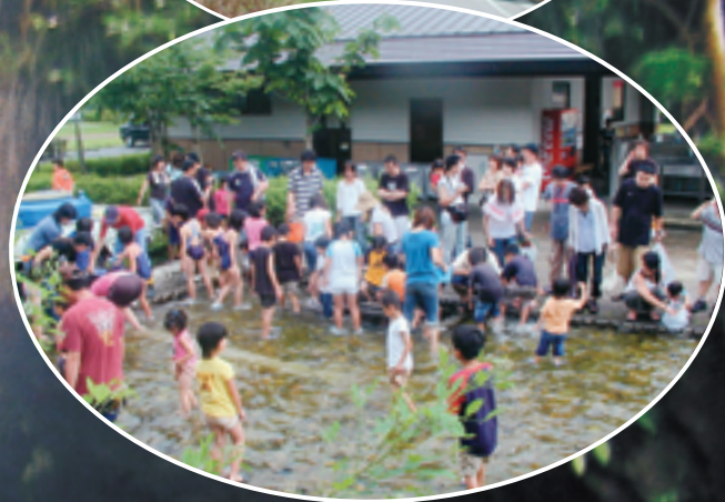
▲NEOキャンピングパーク