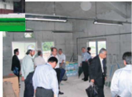
神海下水処理場視察

◎ 道路特定財源制度、出資法上限金利等に関する意見書を発案することに決定。(P3参照) 会議後、西部連絡道(早野、小柿)、真正・神海処理場を現地視察しました。