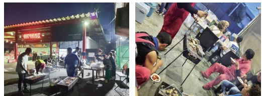
▲社員の家族も一緒にBBQ

社員は会社の宝です。社員への感謝の気持ちとして、結婚記念日のお祝いやお子さんの入学祝いなどのほかに、勤続年数に応じたりフレッシュ休暇や旅行券のプレゼントも行っています。