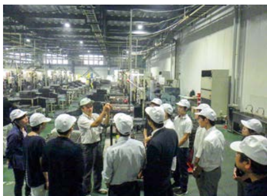
▲工場見学を積極的に行っています

本巢市の国立岐阜高専や本巢特別支援学校など、各種学校からのインターンシップを積極的に受け入れています。今後も希望があれば、市内の学校からのインターンシップや工場見学も行っていきます。