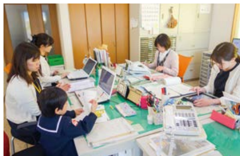
▲子連れ出勤が可能な職場

地域貢献活動として始めた「結婚相談室」では昨年より、本巣市とも協働で結婚支援イベントを行っており、8組のカップルを誕生させたほか、その後のフォローアップなどにも力を入れています。