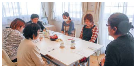
▲女性活躍のための会議の様子

認知症に関する正しい知識を広めたいとの思いから2015年に同グループホームの「谷汲ひまわり」の社員らが中心となって劇団「笑顔の天使」を結成。小・中学校や要請講座などで演劇を披露しました。昨今は、本巢の事業所の職員もその劇団に所属するなど、企業内でも劇団運営に関して一層積極的に取り組んでいます。