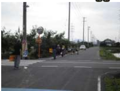
▲地域での登下校の見守り活動 市民が主体的に地域の安心・安全を担っています。