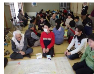
神海いきいきサロンの様子