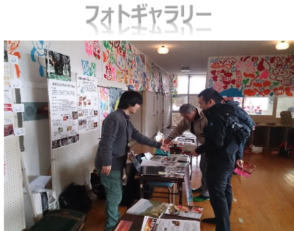
ワガマチマルシェの様子

2015 年 2 月 1 日に愛媛県の大三島で行われたワガマチマルシェに参加しました。瀬戸内海に面した気候が穏やかな場所という印象を受け、都会の喧騒とはかけ離れた雰囲気がこの地域の魅力なのではないかと思いました。全国から総勢 20 名以上の協力隊員が集まり、地域の PR、将来の夢、地域おこしへの想いを語り合いました。グリーンツーリズムで生計を立てたい隊員、自分で作った香水を販売したい隊員など様々な想いをもって活動していることを改めて感じ取ることが出来ました。