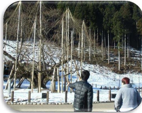
中津川市加子母の協力隊員(右)と 淡墨桜の説明をする東隊員(左)

一緒に根尾を見て回ったあと、喫茶店で協力 隊の課題や任期後の進路などについて、とても 熱い話を聴かせて頂きました。