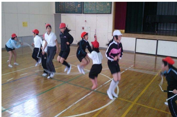
↑寒い体育館をアツくした子供たち♪