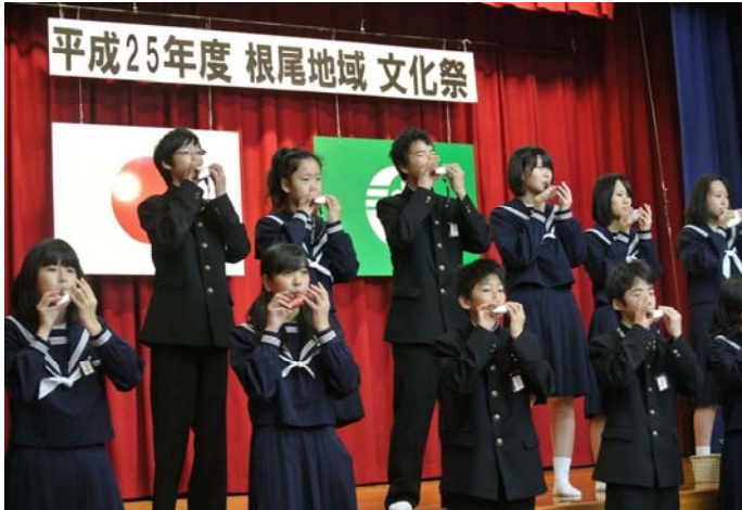
↑文化祭での根尾中学校のオカリナ演奏♪