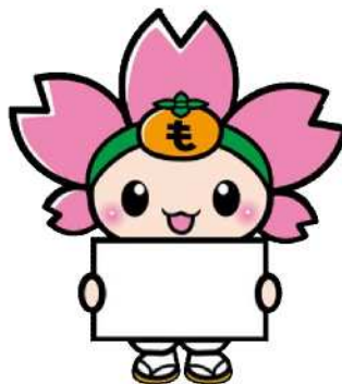
プラカードを持つ01