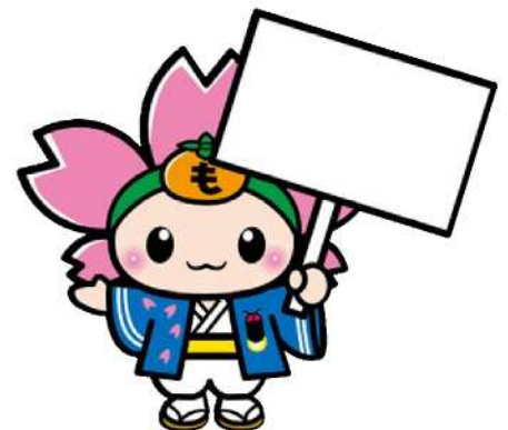
プラカードを持つ02