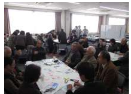
▲まちづくり講座の企画・運営「まちづくり楽校パートナー」 市民が専門知識を生かして、講演会の講師や、市民ワークショップの進行、講座内容の企画などを担っています。

『本巣市市民協働指針』の内容について 詳しくは市ホームページをご覧ください。 http://www.city.motosu.lg.jp/life/katudou/s_hishin/