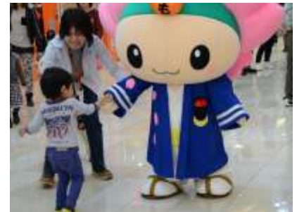
▲キャラクター活用の企画・イベント運営「もとまるパートナー」 キャラクター活用のアイデアやイベントの企画、運営など、市民や事業者が持つ知識や技術を生かした本巣市のPR事業を行っています。