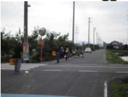
▲地域での登下校の見守り活動 市民が主体的に地域の安心・安全を担っています。