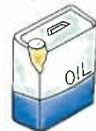
中身の入った 塗料・廃油缶